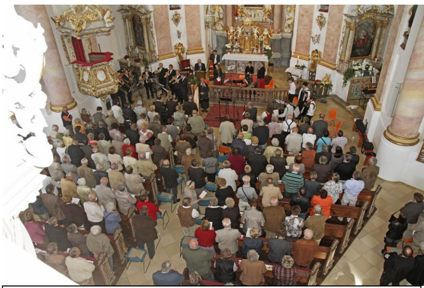
Das volksmusikalische Marienlob am 8. Mai wurde vom bayerischen Rundfunk aufgenommen und am 15. August gesendet