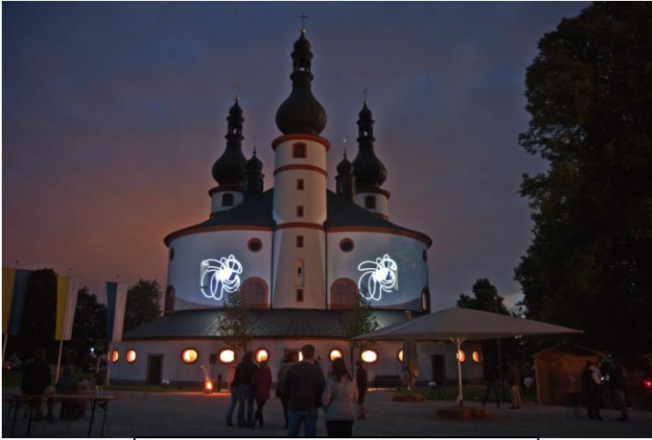
Die Kappl in besonderem Licht